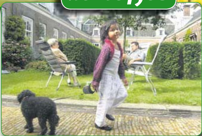
• Hofje van Noblet